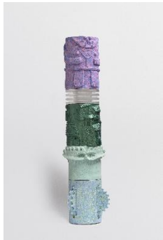
Marion Verboom Achronie n°52 , 2025 Jesmonite et résine 227 x Ø 57 cm W26792