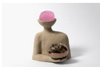
Marion Verboom Chef , 2025 Céramique et cristal 37,5 x 31,5 x 31,5 cm