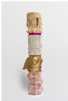
Marion Verboom Achronie n°51 , 2025 Jesmonite et résine 255 x Ø 74 cm W26791