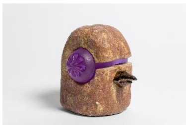
Marion Verboom L'évadé , 2025 Céramique et cristal 17,5 x 15,5 x 17,5 cm