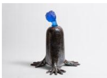
Marion Verboom Ex Corpore , 2025 Céramique et cristal 53,5 x 45,5 x 48 cm