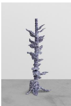
Marion Verboom Apex 1 , 2021 Céramique 197 x 95 cm