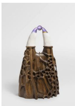
Marion Verboom Clito , 2022 Bois, plâtre et cristal 150 x 90 x 55 cm Courtesy Galerie Lelong Photo © Nicolas Brasseur