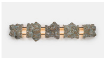
Marion Verboom Sliced Cloud , 2020 Céramique, plexiglas et lampes led 150 x 30 x 30 cm