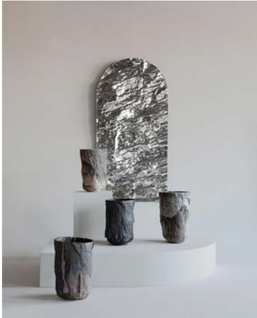
FROISSÉ , armoire murale