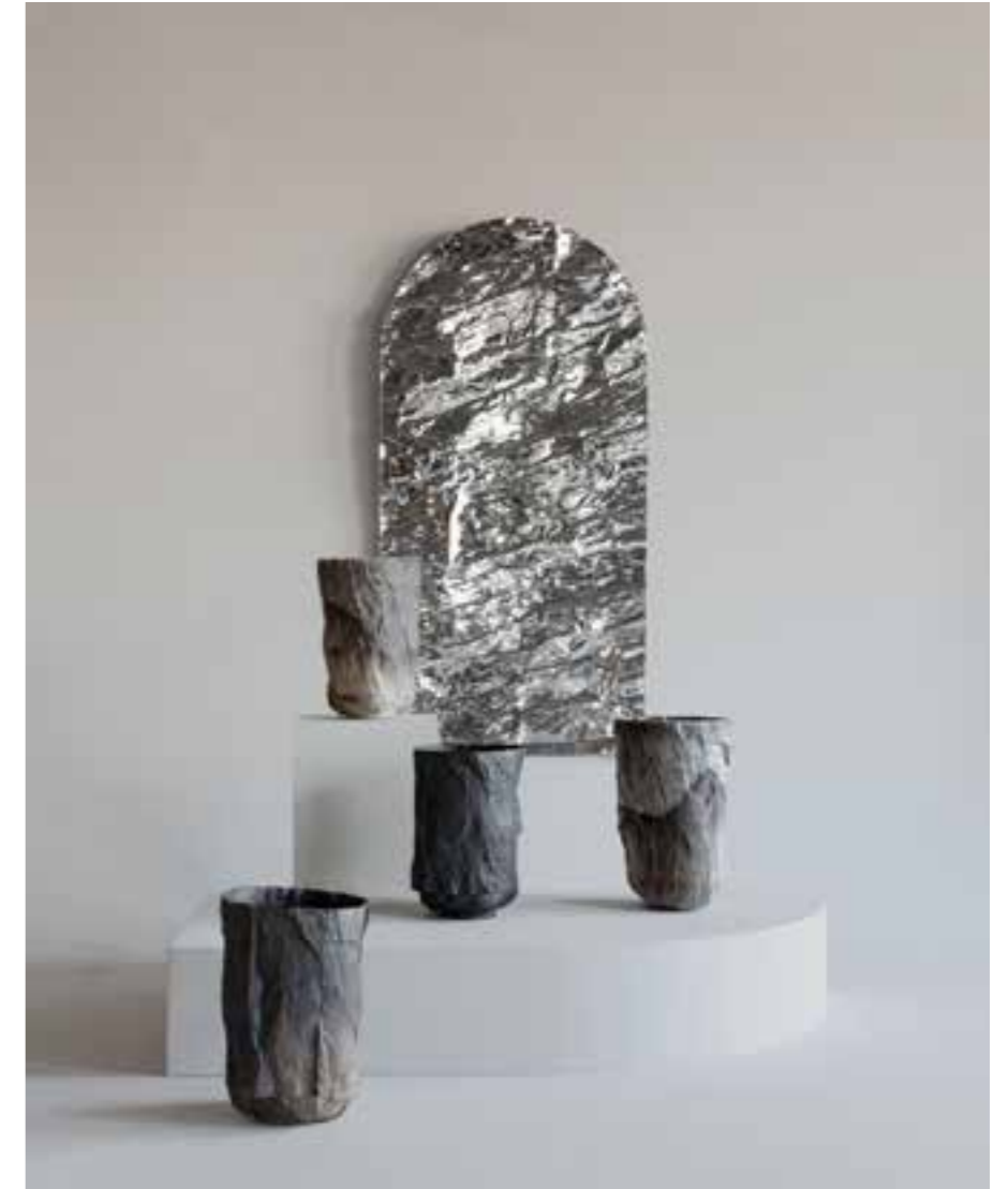
FROISSÉ , armoire murale