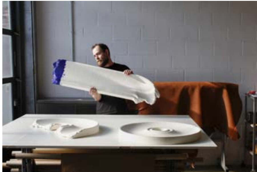
BLANC CASSÉ , miroir