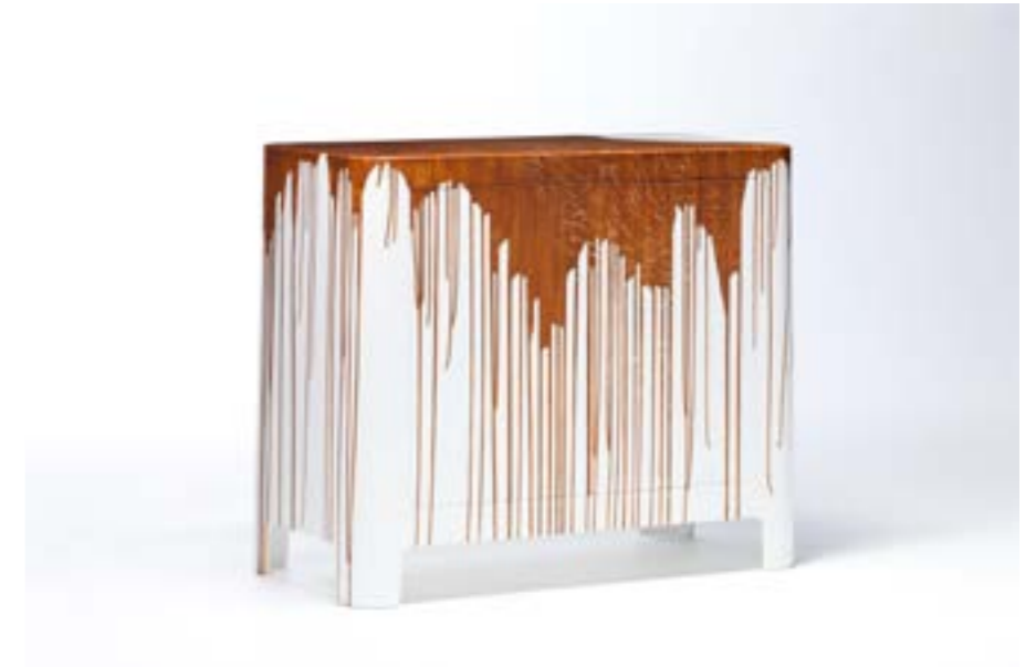
BLANC CASSÉ , tafel