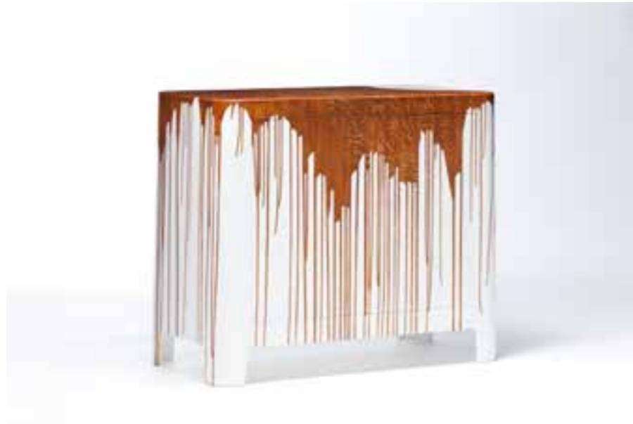
BLANC CASSÉ , tafel