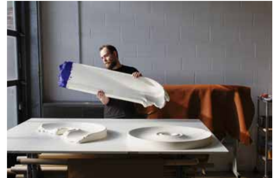
BLANC CASSÉ , spiegel