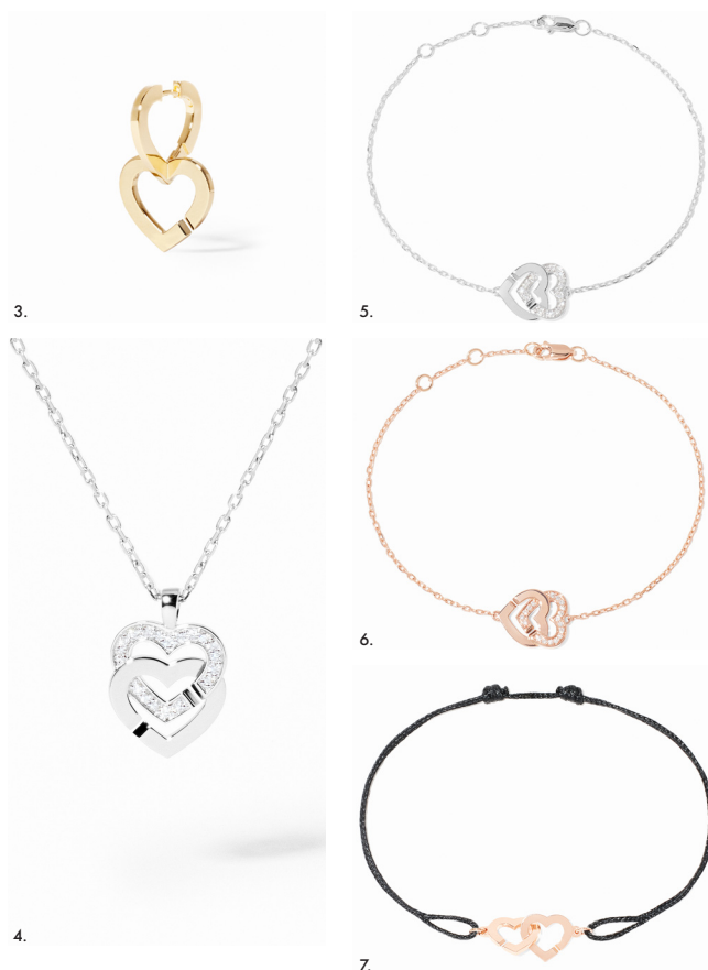
3. Mono-creool Double Coeurs groot model, geelgoud – 1 790 € • 4. Ketting met hanger Double Coeurs klein model, witgoud en diamanten – 1 810 € • 5. Armband met hanger Double Coeurs klein model, witgoud en diamanten – 1 490 € • 6. Armband met hanger Double Coeurs klein model, roségoud en diamanten – 1 350 € • 7. Armband op koord Double Coeurs klein model, roségoud – 750 €.

De zachtheid na de vonk, de tederheid na het vuur, een viering van pure verbondenheid.