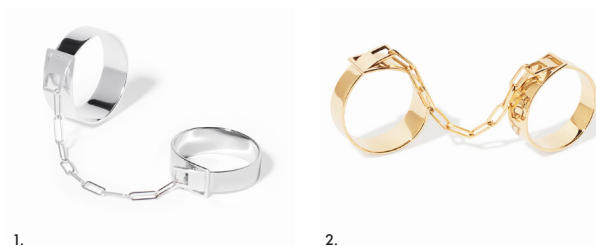
1. Bague Double zilver dinh van x Rabanne, zilver – 650 € • 2. Bague Double dinh van x Rabanne, geelgoud – 3 990 €.

Nu hij opnieuw wordt uitgebracht, vindt de ring van onverbreekelijke liefde moeiteloos zijn plaats in het tijdloze. Of ze nu in goud of zilver schittert, ze belichaamt een nieuwe visie op het verbond: een liefde die generaties overstijgt zonder aan kracht of uitgesproken eigenheid te verliezen. Het is een liefde die haar singulariteit koestert en haar wederhelft vindt. Ze staat voor een alliantie van passie en individualiteit, voor een ontmoeting tussen juweelkunst en mode, tussen twee ontwerpers: een echte stijlverklaring!